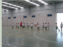
Pavillón CEIP Pedro Caselles Rollán